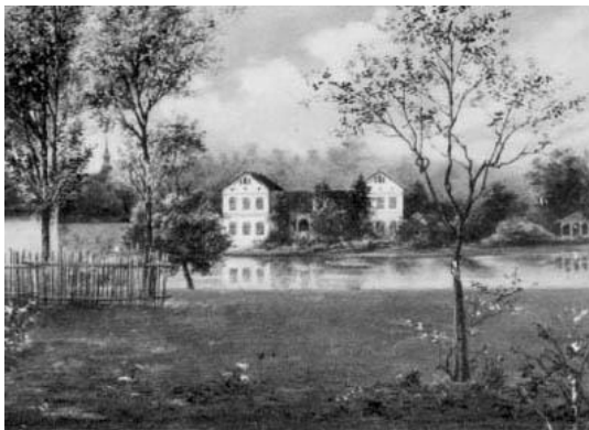
Fotografie stará více než 100 let